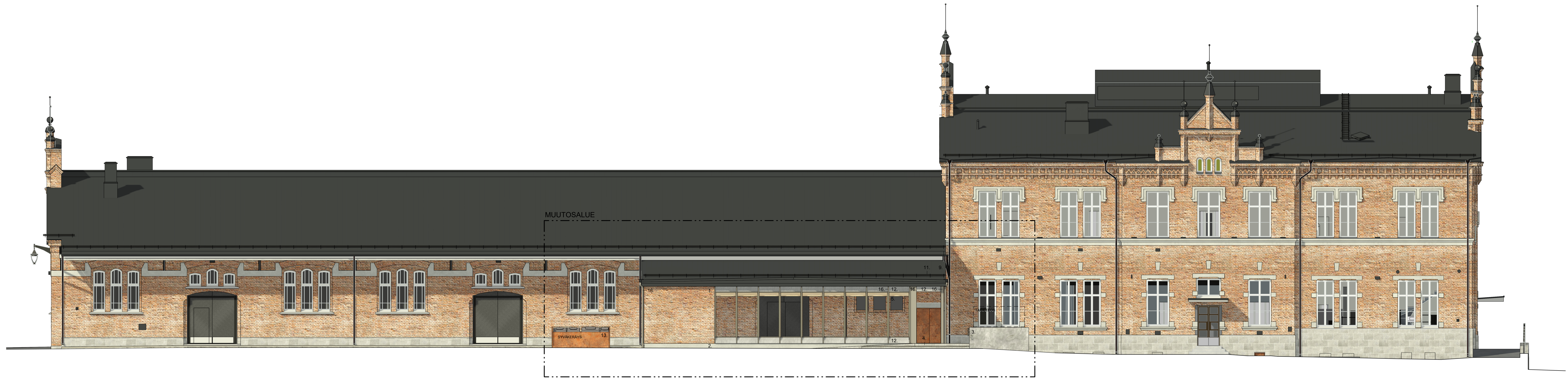
Julkisivu itään 1 : 100